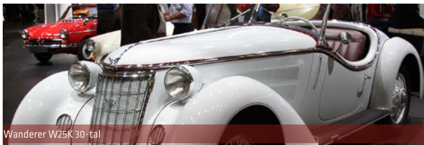
Wanderer W25K 30-tal