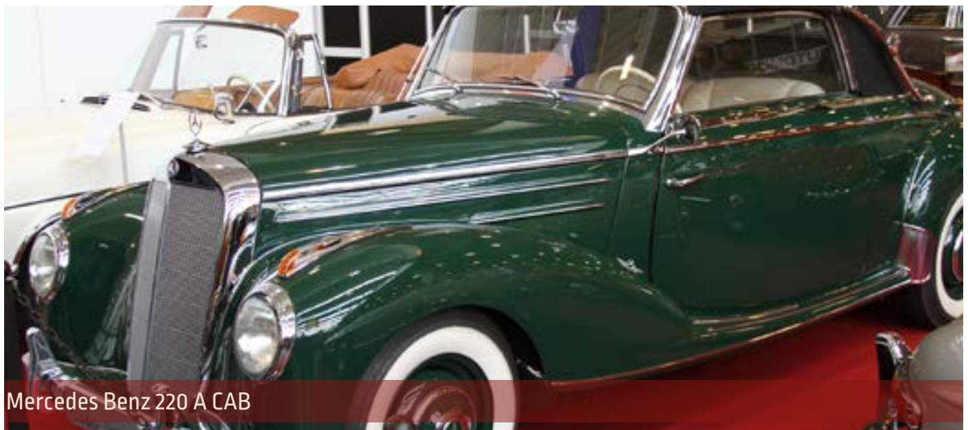
Mercedes Benz 220 A CAB