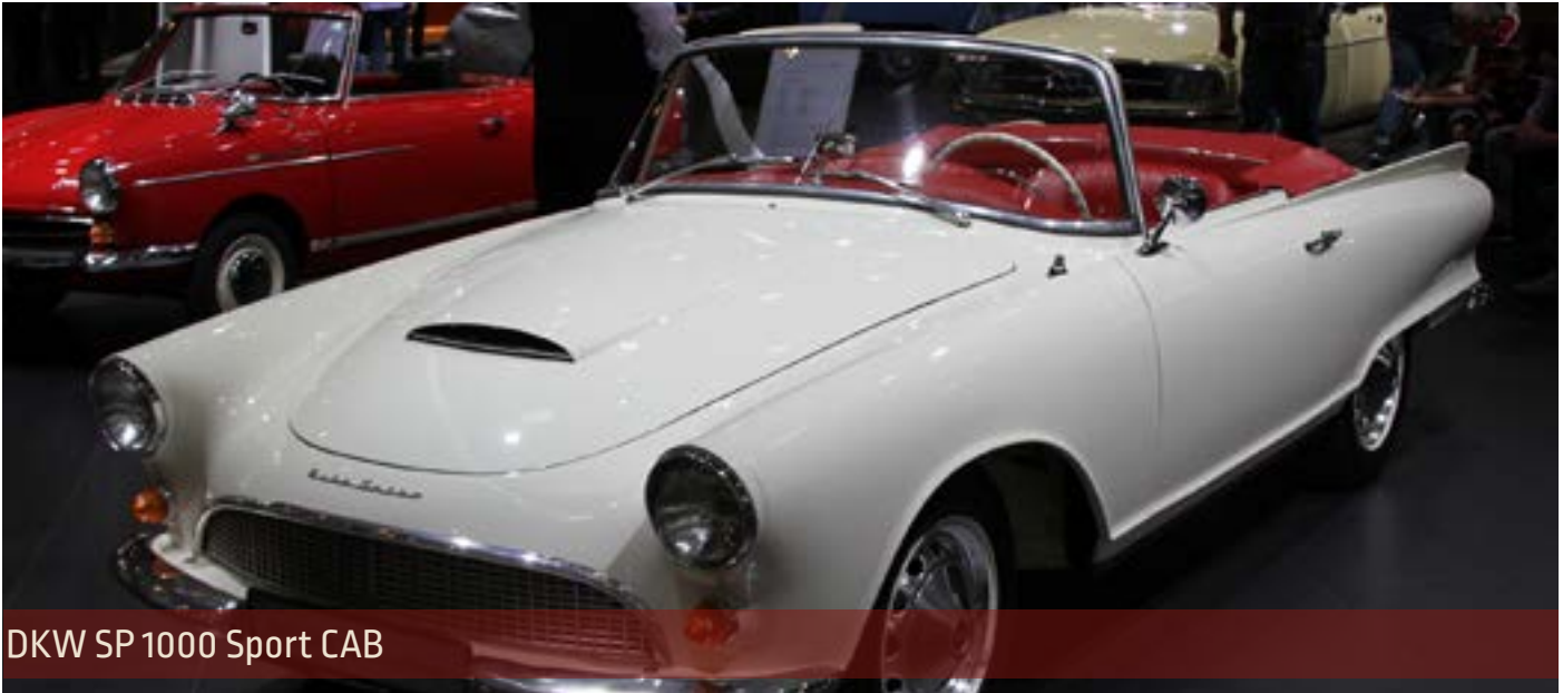
DKW SP 1000 Sport CAB