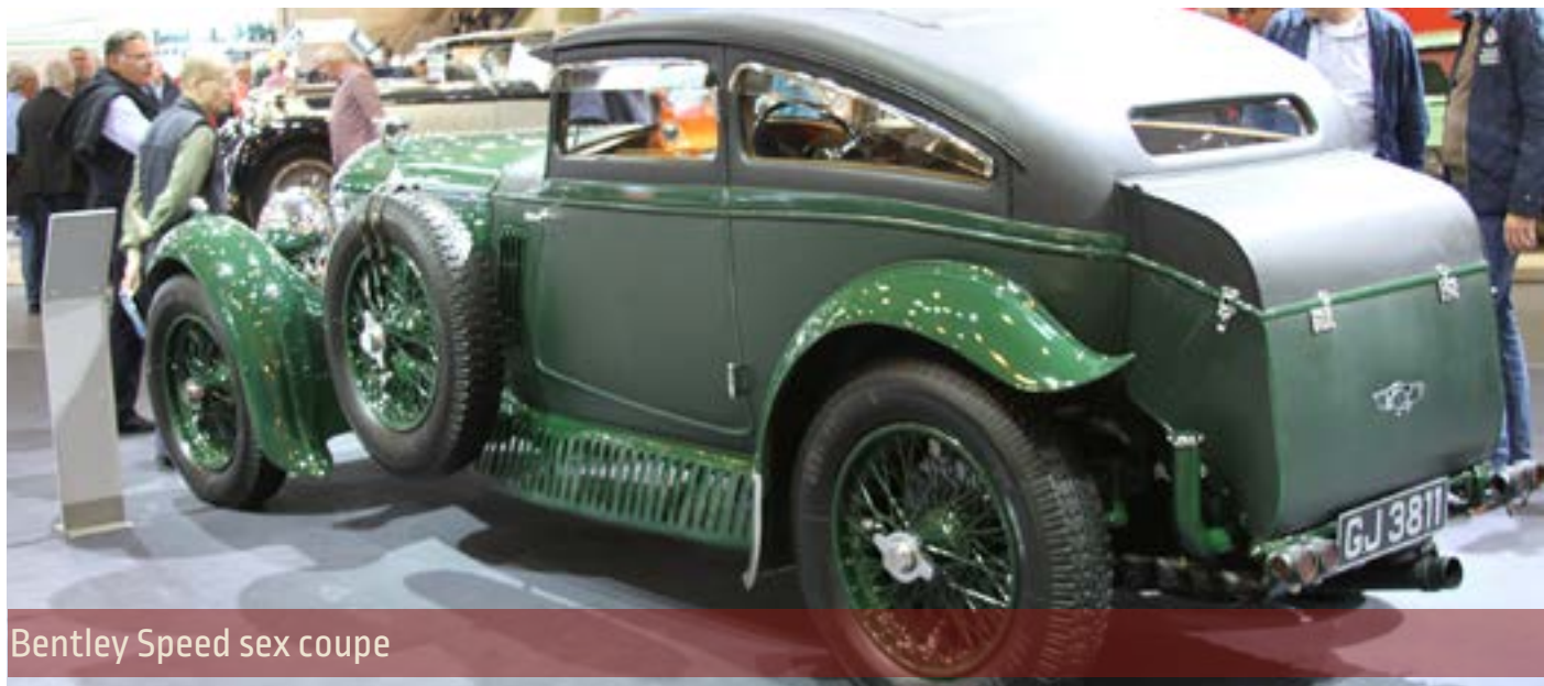
Bentley Speed sex coupe