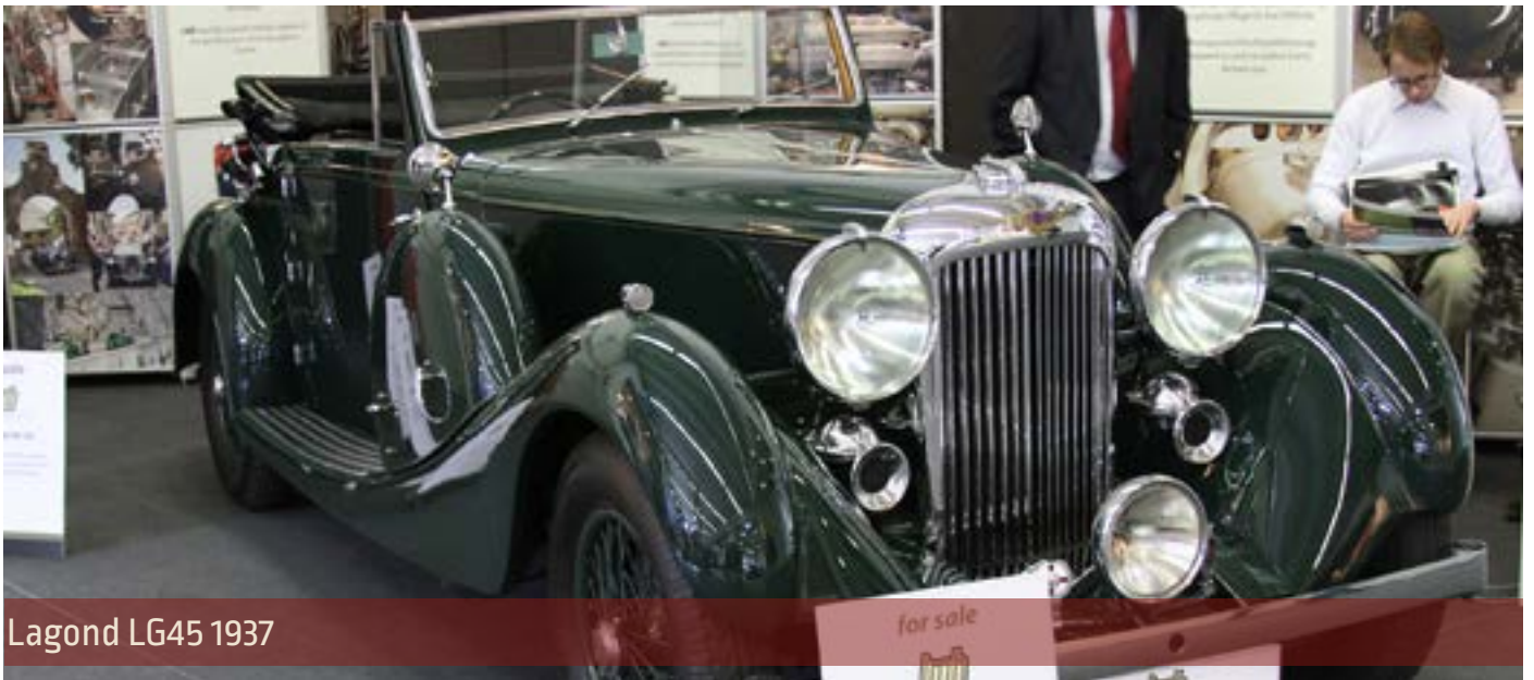
Lagond LG45 1937