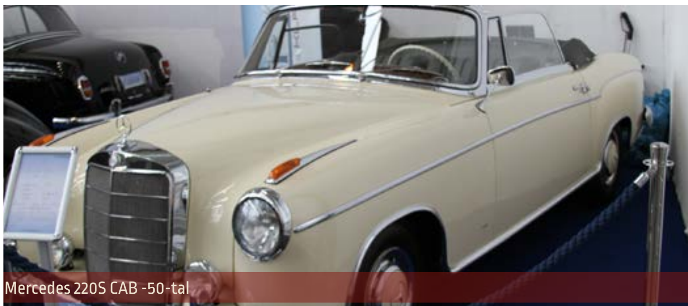
Mercedes 220S CAB -50-tal