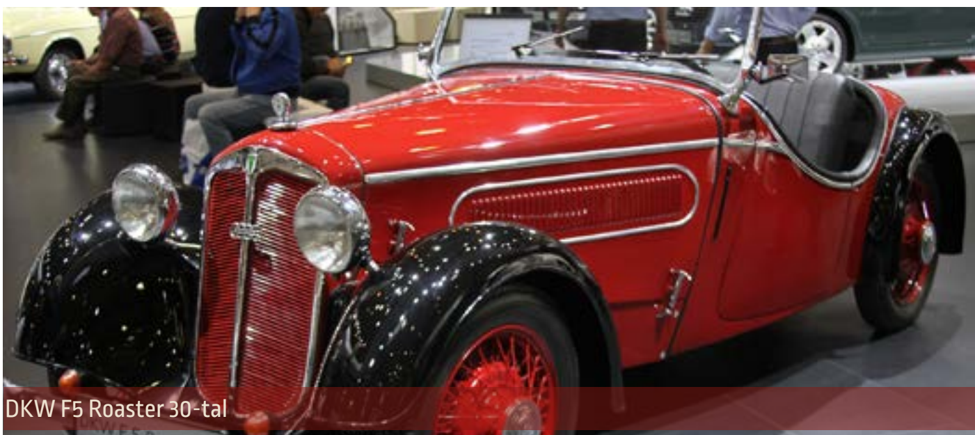
DKW F5 Roaster 30-tal